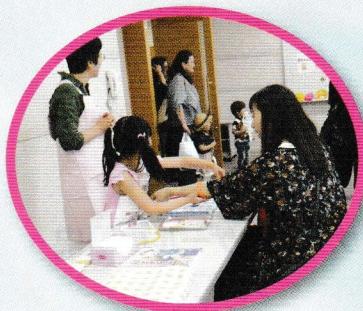
ナースのお仕事体験