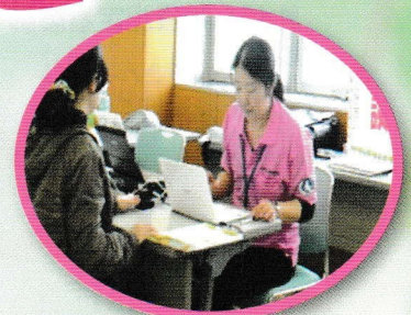
健康測定・健康相談